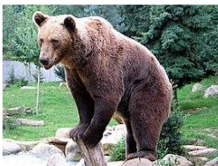
Pilt 1. Karu ehk pruunkalu ( Ursus arctos )