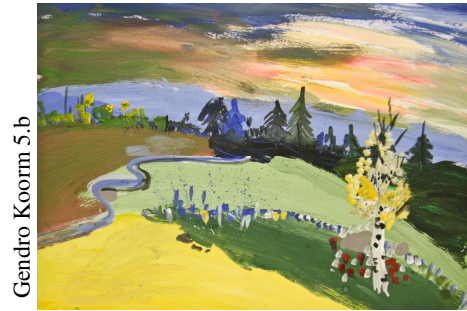
Gendro Koorm 5.b